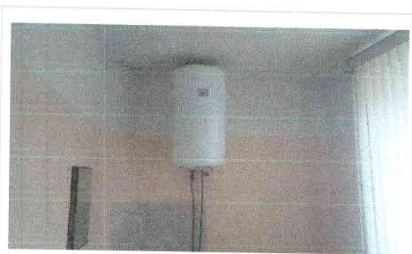
Ūdens sildītājs virtuvē