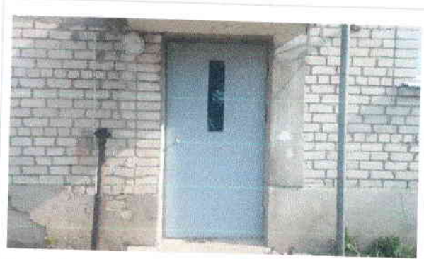
Kārņu telpas ieejas durvis